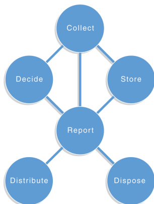
図 3.1 データマネジメントモデル（文献[6]より）

データガバナンスでは、データのライフサイクル（データの収集、保管、決定、報告、配布、廃棄）をベースにしたデータのマネジメントモデル（図 3.1 参照）と経営者が実施すべきガバナンスモデル（図 3.2 参照）で構成されている。前者のデータのマネジメントモデルでは、データのライフサイクルをベースに経営者の果たすべき役割と組織として必要になる機能が述べられている。