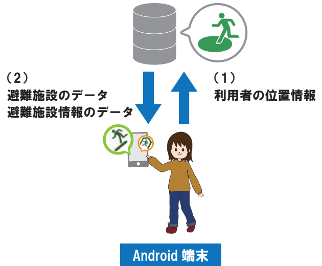
図 1: システムの構成

に情報ウィンドウを使用していた。しかし、情報ウィンドウによる提示は、タスク量が少なく飽きやすいという意見から改善が必要であると考え、クイズ形式による避難施設情報の提示を提案する。