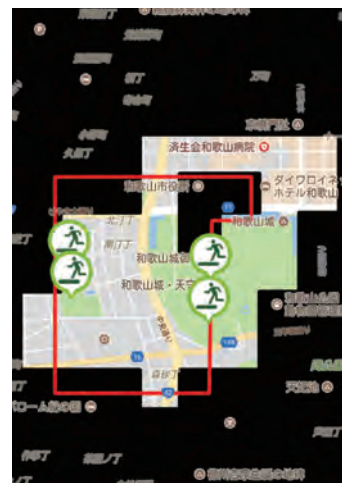
図 7: 実験後の画面例

図 7 に、実験終了後に取得した実験協力者 1 名の画面例を示す。この実験協力者の場合は、自由に歩いた周辺のタイルが剥がれ、画面上に避難施設を表すマークが 4 つ表示されたことがわかる。