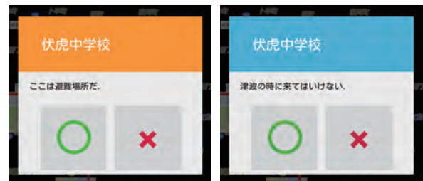
(a) 避難施設に関するクイズ (b) 津波に関するクイズ