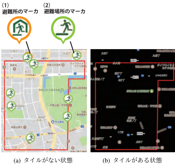
図 5: 実験範囲