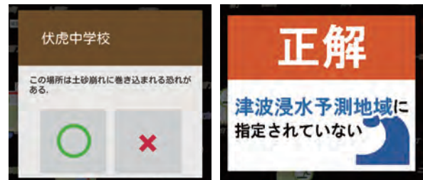
(c) 土砂崩れに関するクイズ (d) 津波に関するクイズの解答