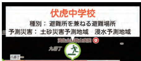
図 3: 情報ウィンドウによる避難施設情報の提示例