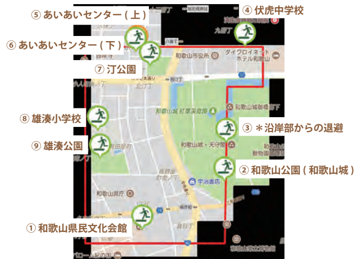
図 8: アンケートのクイズ問題