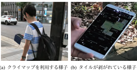
図 6: 実験中の様子