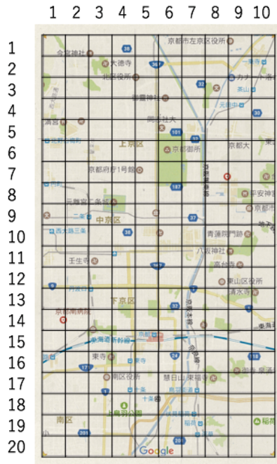
図 1 本稿で対象とする京都市中心部の 200 エリア