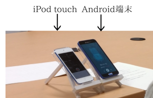
図 1: 実験におけるスマートフォンの設置例