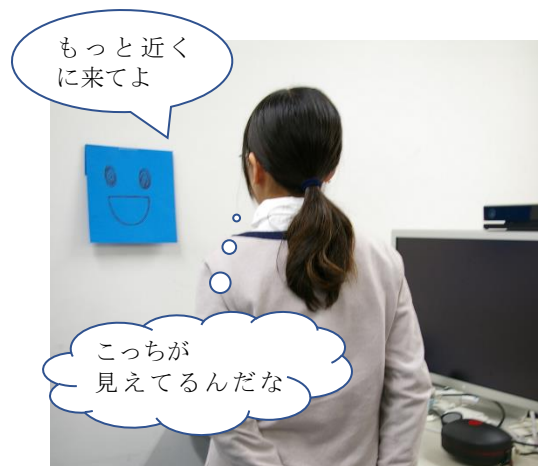
図1:イラスト型エージェントとのインタラクション

ネットワークに接続し外部のセンサから情報を得ることで、センサ非搭載の物体でもエージェント化できる。そこで、センサネットワークを利用し、任意の物体をエージェントとしたインタラクションを製作できるようにするための支援システムが有効と考えられる。