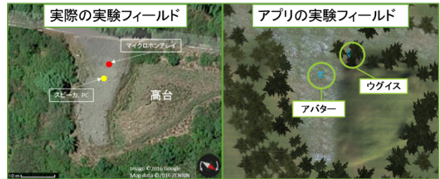
図4：実際の実験フィールドとアプリの実験フィールドとの比較

図4は、同フィールドにおいて、ウグイスに対してスピーカで同種の歌を再生し、その反応を調べるプレイバック実験[4]を行なった際の環境を再現したものである。仮想森林（右）は実環境（左）を模倣して構築し、ウグイスの歌の種類（縄張り宣伝かライバル威嚇か）によって鳥のオブジェクトの見た目を変更した。結果として、ウグイスのプレイバックに対する反応を立体音響で空間的に、また、視覚的にもわかりやすく理解できた。