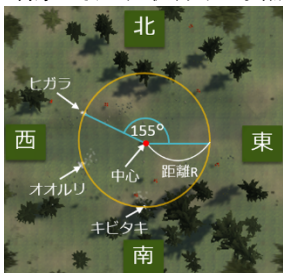
図2：野鳥の位置設定方法

図3に示すように、利用者が探索中に音源に出会うと、その録音環境に棲息するいくつかの種名が選択肢として提示される。利用者の選択結果はデータベースに記録されると同時に、その音源に対するこれまでの選択頻度が示され、自身の選択が最も正しいか確認できるものを想定している。この仕組みにより、利用者は森の中で野鳥の種名を当てるクイズゲームのような体験をしながら、野鳥の歌の注釈付けに貢献できることが期待される。