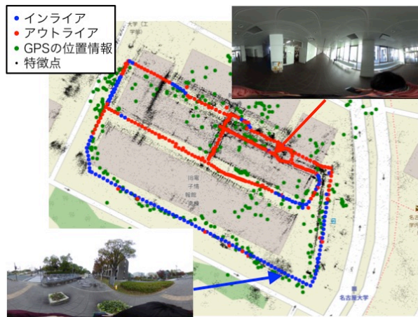
図 2: 推定したカメラ軌跡と特徴点のマッピング結果

本稿では、地理座標空間における屋内外地図を簡易かつ低コストに構築するために、モバイル全天球カメラの画像に対し、SfM で推定したカメラ姿勢とスマートフォンの GPS の位置情報を利用して、屋内外で計測