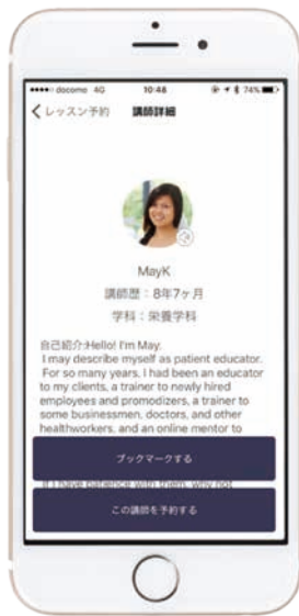
図-3 レアジョブ英会話予約アプリのスクリーンショット 予約

をまたいだ開発体制を敷いています。日本人の顧客に必要なものは日本人エンジニアの方がよく分かりますし、フィリピン人講師に必要なものはフィリピン人エンジニアの方がよく分かります。一方、サービスとしては1個ですので、日本人・フィリピン人双方のエンジニアが1つのインフラを共有して開発を行います。データベースの設計、リリース方法や品質基準などの共有にとどまらず、プロダクト全体の戦略や目標を共有し、国境を越えて仮説検証サイクルを素早く回せるような体制が必要です。