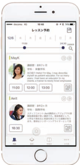
図-2 レアジョブ英会話予約アプリのスクリーンショット 講師一覧