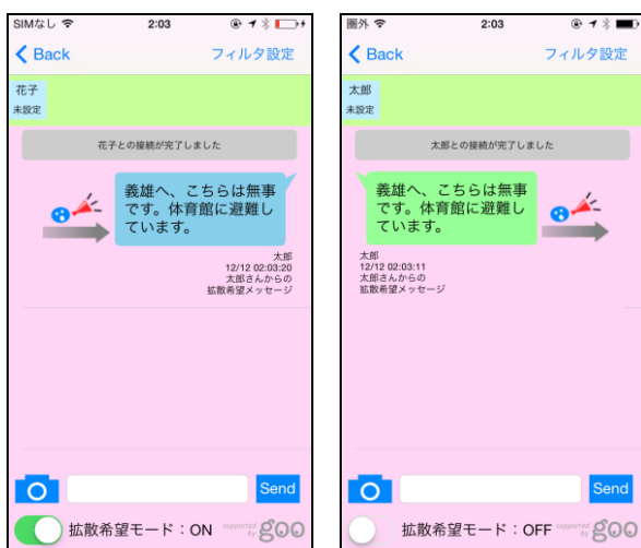
(a)送信側 (b)受信側 図4 拡散希望メッセージの送受信例

また、本アプリで用いる固有表現抽出APIの抽出精度については現在調査中だが、札幌(札幌駅の略称)、トシ(人名の愛称)といった語句は抽出対象外であることが実験的に分かっている。このような語句に対しては、3.5節で述べたフィルタワードリストを用いて適宜フィルタリングする必要がある。