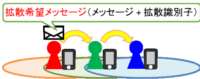
図 2 情報拡散機能の概要 Figure 2 Information diffusion.

ジと呼ぶ。拡散希望メッセージを受信したユーザは、自身の通信範囲内に存在するユーザに対し該当メッセージの再送信が可能となる。