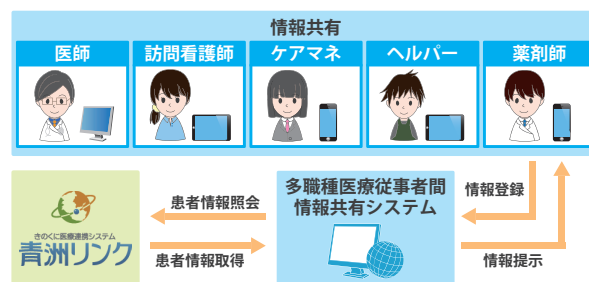
図 1 システム構成

Larsen らは、共同作業に関わる人々の能力に着目し、モバイルビデオ電話を用いた遠隔医療支援システムによるパイロットテストにおいて、作業者の能力は情報技術によるコミュニケーション様式の変化に影響されるのか調査を行った [7]。従来は、医師が患者経由で訪問看護師に治療に関する説明を行っていた。システムを用いることで、病院にいる医師が患者宅にいる訪問看護師に治療に関する指示を直接行えるようになり、訪問看護師の能力が向上した。