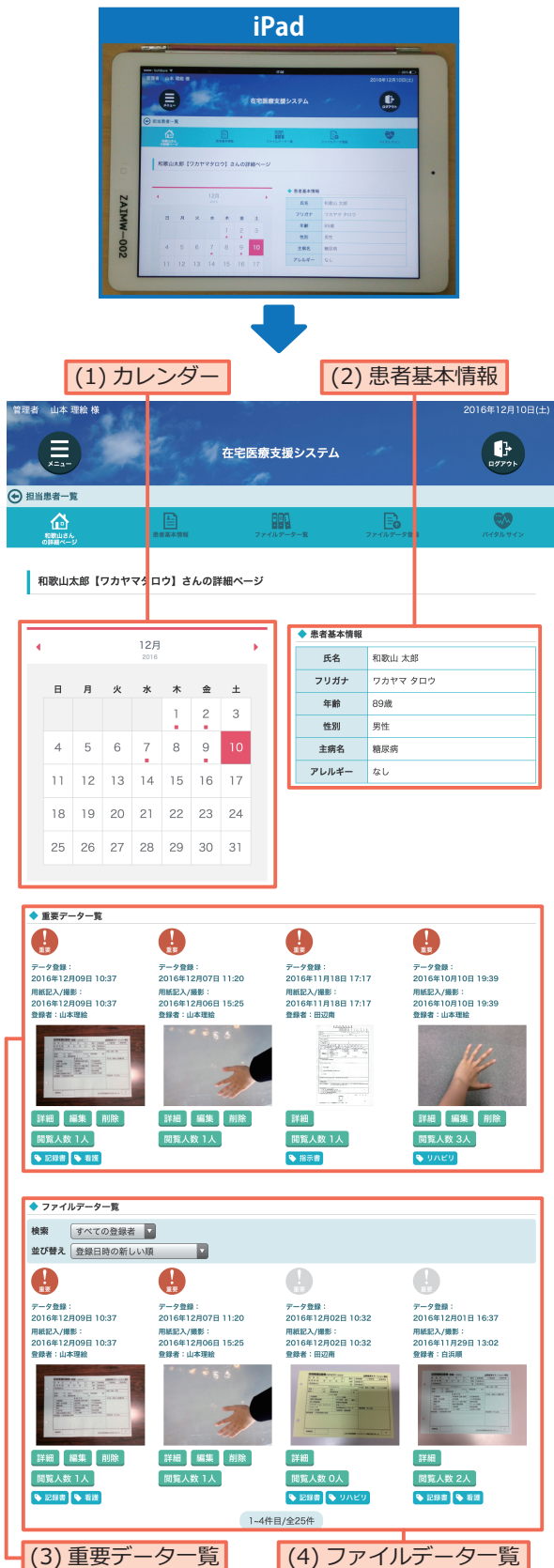
図 2 患者詳細ページの画面例

るための機能である。データの登録・閲覧・編集・削除を行うための機能がある。以下に共有する情報について述べる。