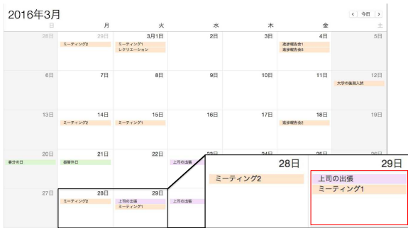
図 5 比較 2: 「カレンダー外の予定」を考慮しないダミーデータ