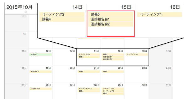
図4 比較1:「就業時間帯」と「カレンダー外の予定」を考慮したダミーデータ