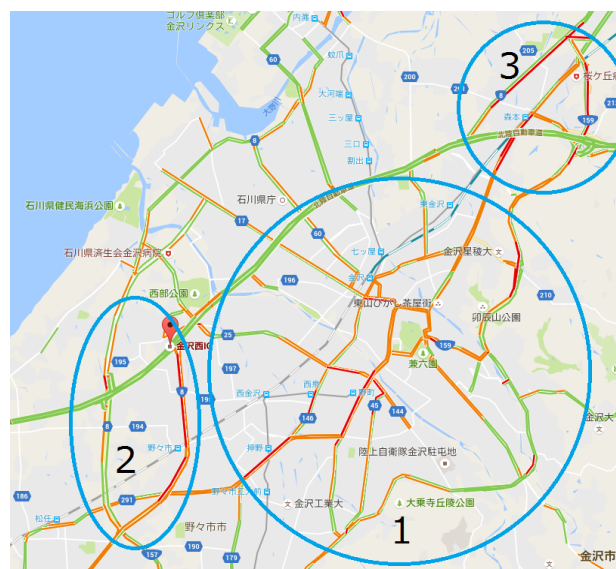
図2 金沢市、野々市市のピーク時渋滞状況

以上のように、現在でも交通渋滞が依然として残っている。理由として、多くの人がP&Rを利用していないということが考えられる。なぜ、多くの人が利用しないのかを次に示す。