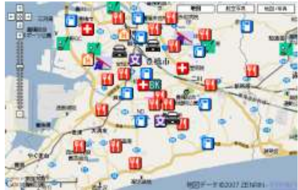
図3. 嗜好考慮なし表示

地図サービスにおいてユーザ嗜好を考慮した地図情報表示の方法について提案を行い、システムを試作した。ユーザの持つ嗜好情報から、ユーザ毎に地図情報の表示を変化させることにより、本研究の目的であるユーザごとにカスタマイズされた地図の表示が可能となった。