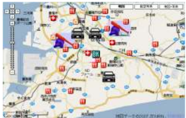
図4. 嗜好を考慮した表示

他にも、地図サービスにおいてユーザに有益となる情報を提供する手段としては、コミュニティが有効に働くと考えられる[6]。嗜好の類似したユーザや、投稿された情報に関して詳しい知識を持つユーザ同士でコミュニケーションを行うことは、Web上にはない新たな情報の創出が期待される(現在のWebは情報過多の状況にあるが、全ユーザが持つ情報をカバーしているわけではない)。従って、本システムにおいて、コミュニケーションの仕組みを取り入れることによって、ユーザに有益な情報を提供できる可能性が広がる。