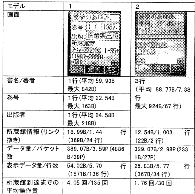
表4 画面モデルごとの比較