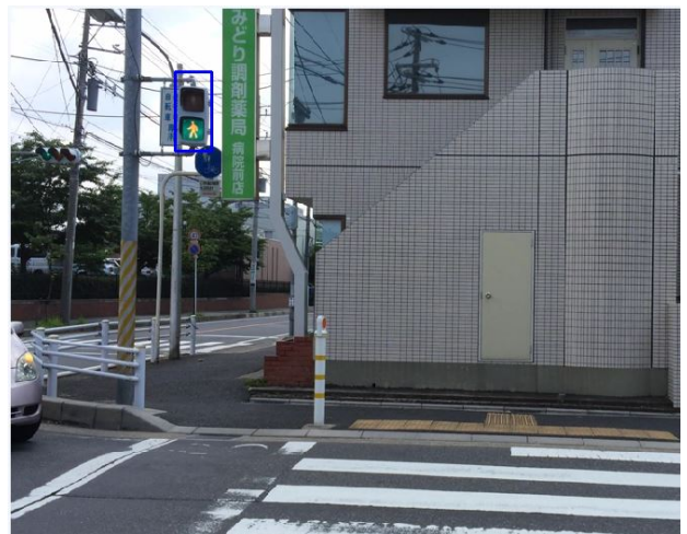
図 4. 青信号の認識例