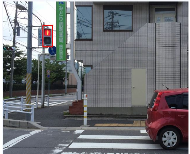
図 3. 赤信号の認識例