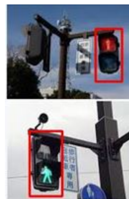
図 2. Haar-like 特徴による検出結果

本研究では画像処理のライ ブラリである OpenCV に用意さ れている Haar-Like 特徴を用い た学習により信号機の検出器を 作成した。作成には正解画像 1000 枚、不正解画像 800 枚を 使用した。信号機の検出精度は 表 1 のようになった。