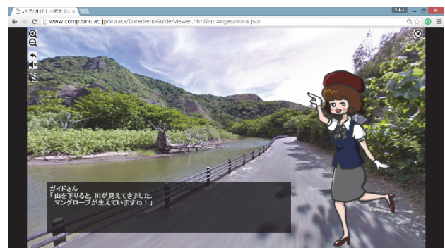
図 2 閲覧ツールの画面例