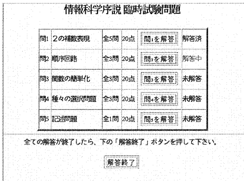
図 2: 試験システム画面