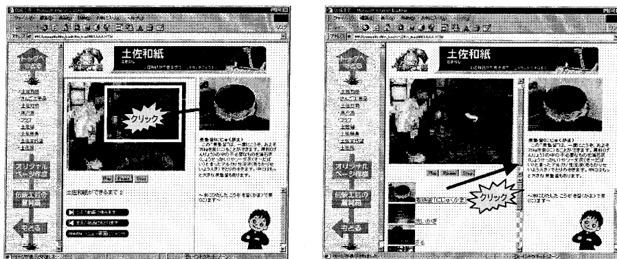
①動画ハイパーメディアを利用した場合

動画ハイパーメディアを利用したコンテンツでは動画中の物体をクリックすることで詳細情報を表示することができ(図2①参照)、同様の機能を従来技術で実現したコンテンツでは動画中に現れる物体の一覧を動画の下部にリストとして表示し、リスト中の文字列をクリックすることで詳細説明を表示できる(図2②参照)。