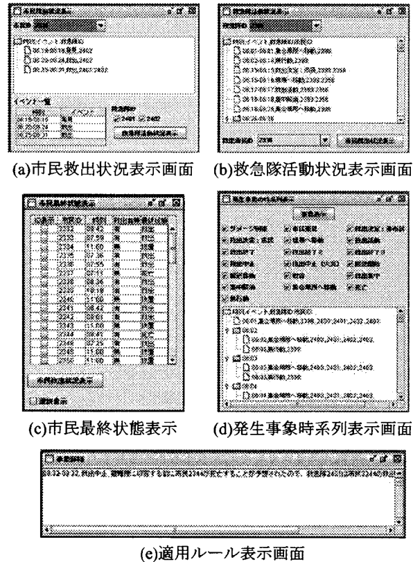
図3. プロトタイプ画面イメージ

因果関係解析技術は適用する推論技術に関して検討を進めている段階であるため、現時点ではユーザが各画面を操作しながら注目事象と相関のありそうな事象を推定することしかできない。今後推論機能の具体化を進め、因果関係解析の自動化を実現する予定である。