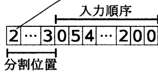
図2: 遺伝子表現の例