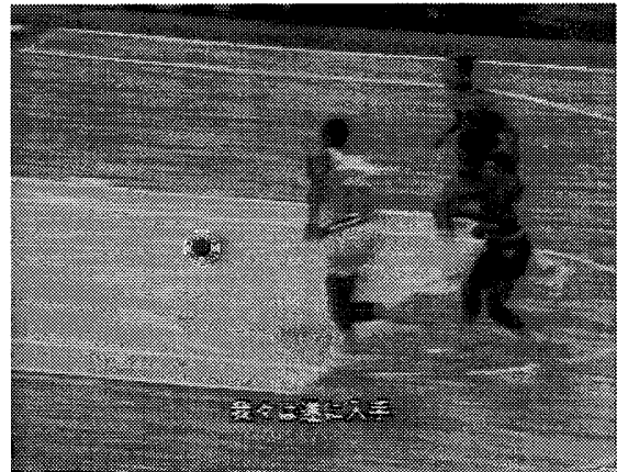
図 1 ボール認識の成功例 1