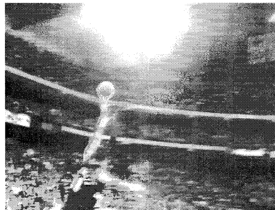
図 2 ボール認識の成功例 2