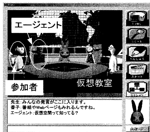
図2: 仮想教室画面例

ネットワークを通じたグループ学習では、グループの構成要因が動的であるため、テキストの送受信だけでは発言者を特定しにくいという問題点がある。そこで、学習参加者のIDと発言内容を元に、発言者の特定がしやすく、見ていて飽きの来ない映像を自動付加するため、実際に放送された討論番組(42対談、30時間、9000カット)を様々な角度から分析し、映像演出の統計的算出を行いこれを実装した。