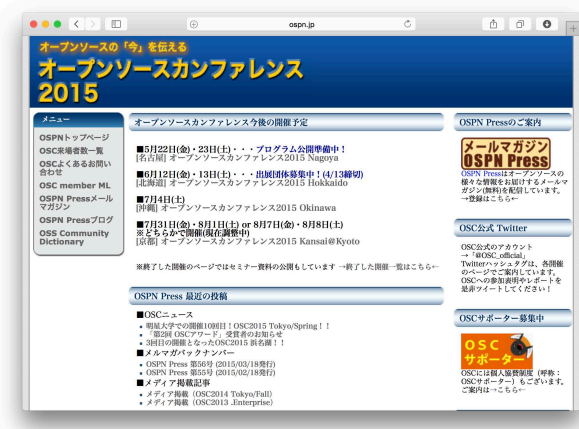
図1: オープンソースカンファレンスのウェブサイト