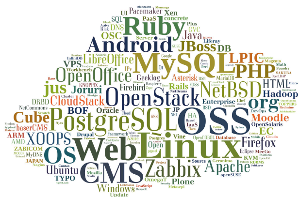
図 4: 発表タイトルに現れた英文キーワードによるワードクラウド (tagxedo.com により作成)