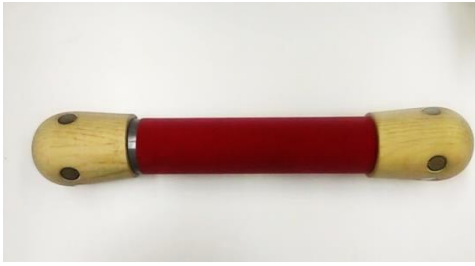
図2 コントローラの外観