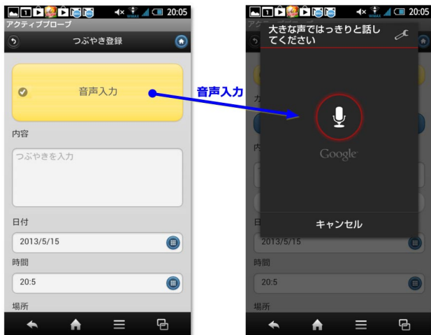
図2 音声による「つぶやき」登録画面