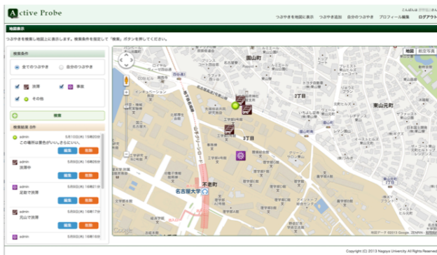
図4 Web上での参加者「つぶやき」情報の表示

つぶやき内容や位置情報、カテゴリ、登録時刻等を、スマートフォン上および Web サイト上から修正可能な機能も構築した(図4)。