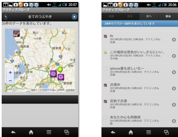
図3 地図表示と「つぶやき」リスト