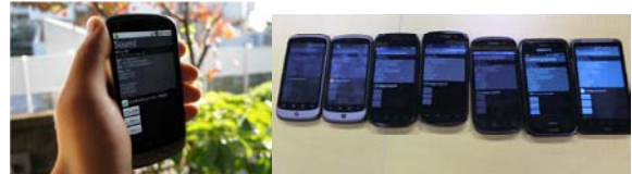
図 2: Android 上で実装した騒音計測システム

本システムは普及の観点から GPS の取得容易性とアプリケーションの開発を図 2 にあるような Android 端末により行っている。