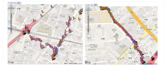
図 5 は本 CommuSense を用いて下北沢、相模大野駅周辺のノイズレベルの騒音を計測した様子である。~50db : 水色, 50 db~60 db : 青, 60 db~70 db : オレンジ, 70 db~80 db : 紫, 80 db~90 db : ピンク, 90 db~ : 赤で示す。

駅前には騒音レベルが上昇している様子が色からも理解でき、歩行による計測の有用性が分かる。本アプリは近日中に公開し、多くのユーザと計測コミュニティを形成し、不動産情報との連携を試みる。