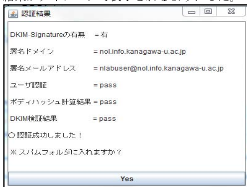
図3. 認証結果をダイアログで表示した MUA

実験ではコマンドラインから引数を指定して実行するようにした。メールの認証を行ったときに図3のように認証結果がダイアログで表示されるようにした。