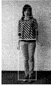
(a) 上下衣領域抽出例