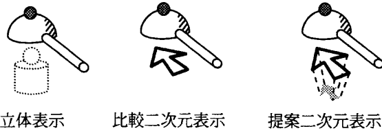
図3. 実験に使用した表示方法

実験オブジェクトには、触ったり叩いたりすることで音が発生する直方体の楽器オブジェクトを用意した(図2)。楽器オブジェクトの上にはマス目と1から8までの数字が書かれている。数字が書いていないマス叩いても音は発生せず、数字が書いてあるマスを順番に叩くと、ドレミファソラシドの音階が順番に発生する。