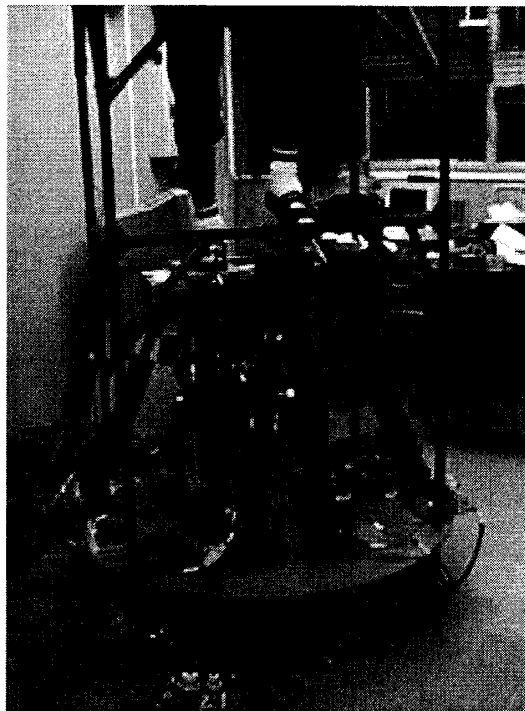
図2 Gait Master

有効である。障害の程度に応じて床の方が歩行を助ける力を貸すことができるからである。21世紀は高齢化社会の時代とも言われるが、このような福祉応用がVRの重要な応用分野になっていくであろう。