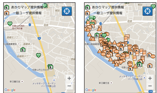
(a) 実験前 (b) 実験後

表 1 から、スマートフォンを利用している実験協力者の住民は 17 名中 2 名だった。実験協力者の学生は 16 名全員がスマートフォン利用者であった。表 5 より、システムの操作性については、実験協力者の住民よりも実験協力者の学生の方が評価が高かった。操作性に関する評価が高かった実験協力者の学生のアンケートより、「スマートフォンの操作に慣れていたので簡単だった」というコメントが得られた。実験協力者の学生は普段からスマートフォンを利用しているため、「あかりマップ」の操作は特に問題なく