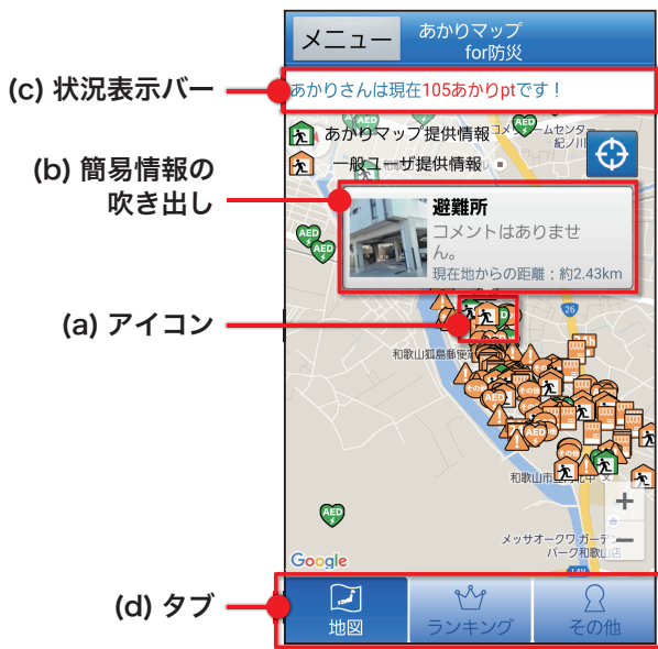
図 2 地図画面例