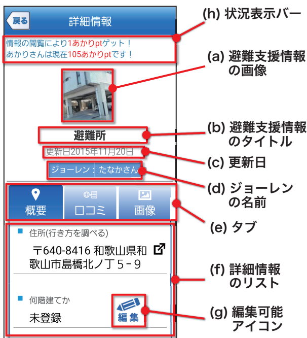
図 3 詳細画面例

に表示されているアイコンをタップすることで、吹き出しが出現し、避難支援情報の簡易情報を閲覧することが可能である(図 2(b))。画像のデータがある場合は、あわせて表示する。吹き出しをタップすることで、避難支援情報の詳細情報を閲覧することが可能である。詳細情報画面については、3.2.2 項で説明する。