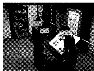
図 1: ポスター発表会話