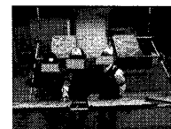
図 2: 自由会話

自由会話は、ポスター発表会話と同じように対象物への指差しや視線が発生するよう、会話環境に昔の京都を描いた屏風絵を配置した。被験者もポスター発表会話と同様の 3 人とした。その一方で、被験者は対等な友人同士とし、教示は「周囲のポスターに描かれた建物や季節の推定・描かれた年代の推測などを自由に行ってもらおう」という形にした。これにより発表者と聞き手という役割があるポスター発表とは異なる会話環境を作り出すことを目指した。