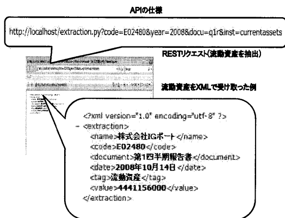
図 1: API の仕様

種別、抽出したい値の会計科目の REST リクエストを送信する。また、出力結果は XML 形式やテキストデータ、各種プログラミング言語で利用するためのオブジェクト形式で取得することができる。図 1 には、ある企業の流動資産の値を XML 形式で取得する例を示す。