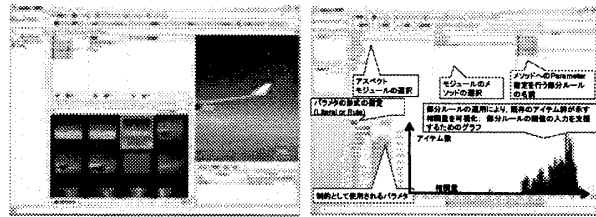
図 3: アクティブ・マルチ DB システムの UI 画面

ルの構造を大局的に可視化することにより、ECA ルールの共有率・ボトルネック部分を容易に分析することができる。