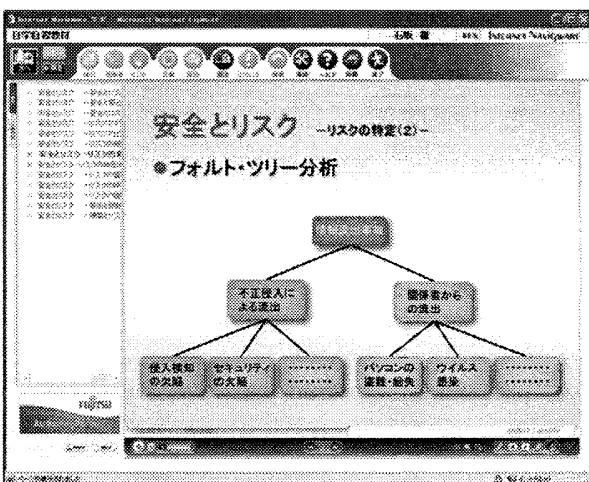
図2: コンテンツ再生画面