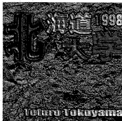
Fig.1 使用した地面用のテクスチャ