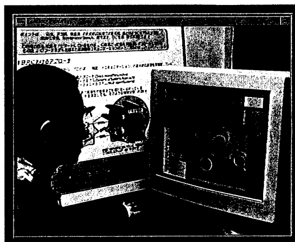
図 3: 「複数の心」との対話

質を持つ複数の仮想生物すなわち「複数の心」と対話を行うインタラクティブシステムを紹介した。