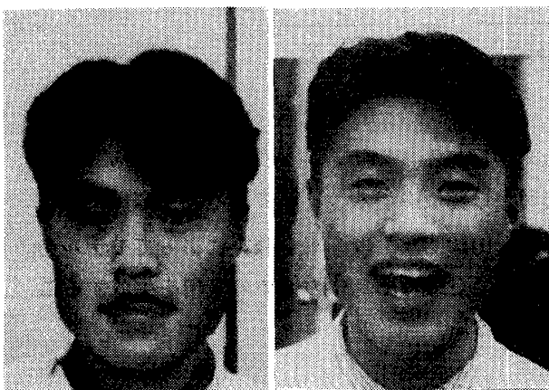
図4-1 L_k ファイル作成時に用いた顔に「あ」という表情を施した画像 図4-2 L_k ファイル作成時に用いた画像