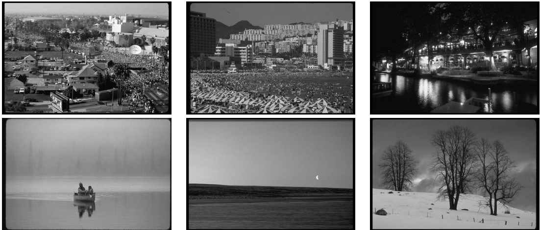
図2 風景画像の例(上段:「にぎやか・活気のある」,下段:「寂しい・静かな」)