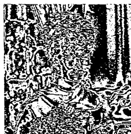
(a) 下位ビットプレーン

画像データの中で、人間にとって有意な情報はエッジ上の不連続点のような特徴点に集中していると考えられる。ビットプレーンを上位から下位へと順に見ていくと白黒境界点の密集している部分が次第に多くなっていく。図2に下位ビットプレーンと不連続点の分布を示す。下位ビットに見られる不連続点の密集している部分は、それぞれのビットプレーンでは"ノイズ"のように見え、あまり重要な情報と思われる。従って、"或る領域内で不連続点が或る一定以上に密集した部分の情報は捨て、不連続点の疎な部分はもとのまま保存する"ことは人間の一視覚特性に合った情報圧縮法であると考えられる。そこで、取捨選択の指標としては、 n 番目のビットプレーンの部分画面に対して