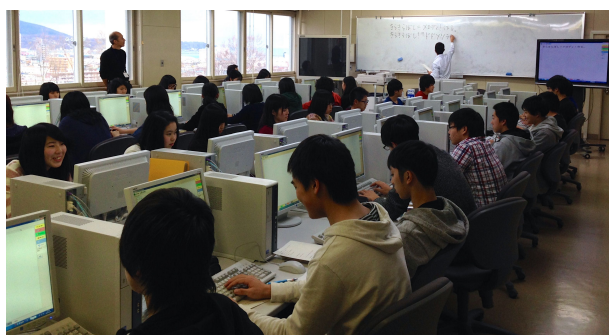
図1 高校での授業風景

授業はコンピュータ教室にて、一人1台のコンピュータと授業プリントを用いて行う（図1）。第7回の授業で用いた授業プリントを図2に示す。