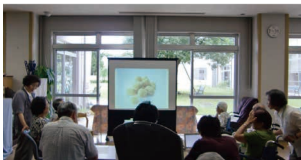
図-2 介護施設における共想法実施の様子

をしながら周囲の反応を聞く、すなわち、話すことと聞くことの複数のことに同時に注意を向ける、注意分割機能の活用を支援できる。あらかじめテーマに沿って準備した話題を、時間内にまとまるよう組み立てて話す、計画力を含む実行機能の活用を支援できる（表-7）。