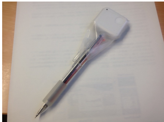
図 2: 加速度センサを取り付けた筆記具

学習状況の推測部分では、3.1節で述べたように市販の筆記具の上部に加速度センサを取り付けたものを利用した(図2)。加速度センサはワイヤレステクノロジー社製のWAA-010を用いており、データはBluetooth経由でPC側へ送信する。提示部分では、現段階ではPCにUSB経由で接続したArduino UnoのボードにLEDを取り付け、制御を行っている。最終的には、ペン立て等の学習机の上に自然に置かれているような物をデバイスとして利用したい(図3)。その他、情報提示デバイスを制御するソフトウェア、各ユーザーの状況を管理するサーバーで構成される。