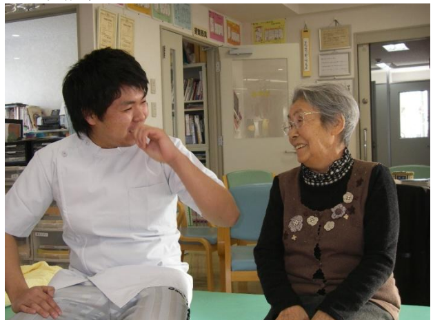
図1. 介護施設での様子

医療サービスの質は患者の疾病の度合いなどである程度のパターン化はできるが, メンタルヘルスクエアや接遇の側面からみた場合, 提供されるサービスというのは患者によって差異が生じるため, 顧客である患者は高次の満足度を期待する. 介護施設における調査をした結果では, 患者と常に会話を絶やさない環境下では, 提供されるサービスに関して, 統合的であり満足度が非常に高いという結果がでている.