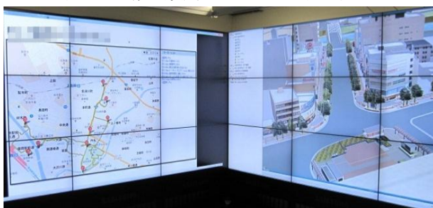
図4 3次元可視化機能の利用イメージ