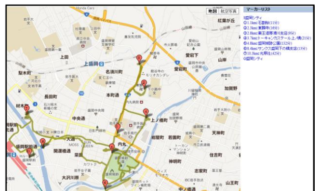
図1 走行軌跡と滞在地の抽出

秒として移動・滞在判別を行う。次に、全滞在地をGIS（地図太郎）で可視化し、滞在回数により多くの観光客が立ち寄るスポット、観光客受け入れ側が想定していないスポットを抽出する。滞在回数が最も多いスポットは、5回の商業施設、盛岡城跡公園、光原社であった。また、22件の走行軌跡を地図上に重ね合わせることで、観光客が頻繁に通る経路を分析した結果、開運橋から大通り、菜園通りを通る経路と分かった。走行軌跡と滞在地の抽出を図1に示す。