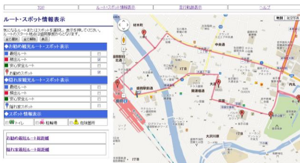
図3 お勧め頻出ルート・スポット表示

観光サイクルマップは、走行軌跡表示、スポット情報表示、ルート表示の3機能を持つ。走行軌跡表示機能では、レンタサイクル利用者が自転車を借りた日付とホテルを選択して走行結果を閲覧する。スポット情報表示機能では、盛岡自転車会議の資料を参考に、危険箇所、駐輪場、トイレ情報をマーカーにより表示する。ルート表示機能では、GIS分析結果より滞在回数2~5回のスポットを周るルートをお勧めルート、1回のスポットを周るルートを隠れ家ルートとする。また、各ルートに対し、最短、頻出、安心安全ルートと各スポット情報を提供する(図3)。最短ルートは、Google Maps APIによって各スポット間の最短経路を求めた。頻出ルートは、GIS分析結果より開運橋から大通り、菜園通りを主に通る経路とする。安心・安全ルートは、盛岡自転車会議の資料を