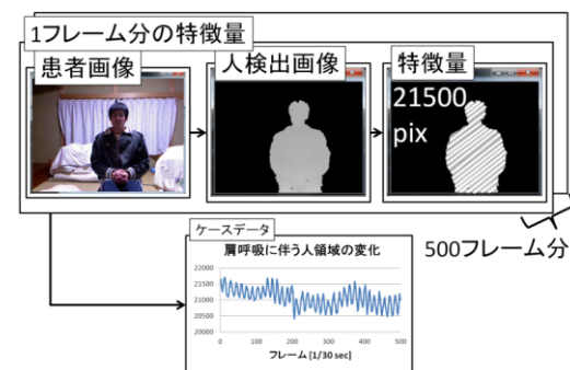
図 2 肩呼吸のデータ化フロー

A study on automatic detection system of high-severity outpatient: Hard-breathing detection from video image sequence