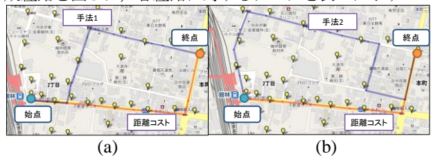
図3. 生成経路 (a) 手法1, (b) 手法2

[1]で観測された実験データに基づいて、提案手法と距離をコストとした経路探索での生成経路の比較を行った。2010年8月21日の16:00付近のデータを用いた場合の生成経路を図3に、各経路に対するデータを表1に示す。