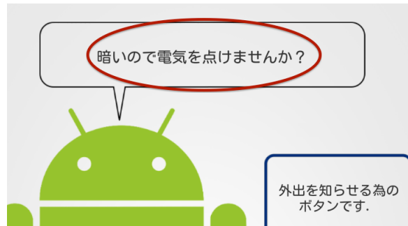
図 4 冥暗時の画面表示