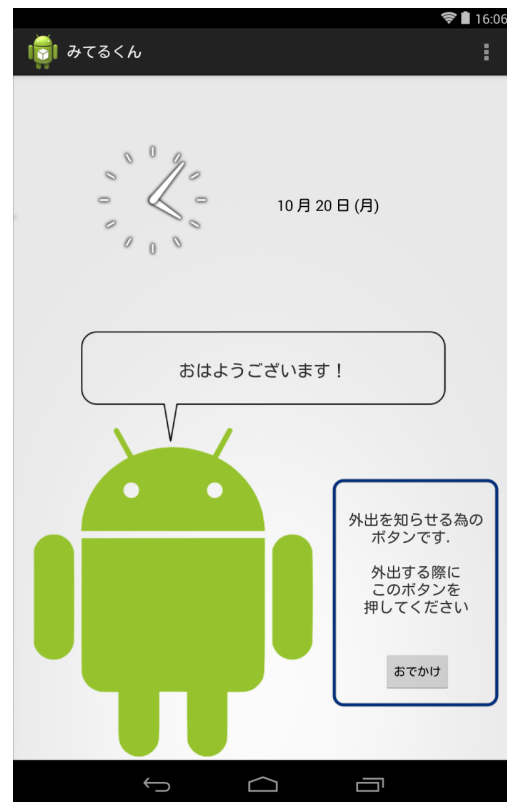
図 1 安否確認用アプリケーション「みてる君」のみまもり画面

上記の既存のアプリケーションでは、安否を確認する為 2014 Information Processing Society of Japan