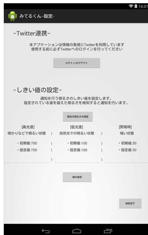
図 2 安否確認用アプリケーション「みてる君」の設定画面