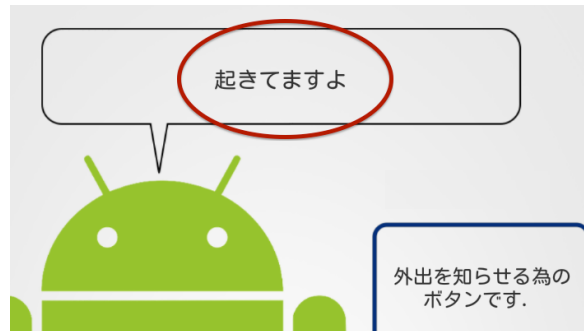
図 5 見守り時の画面表示

人が活動を行う場合、明るい場所であることが一般的である。屋内で生活している場合、部屋が暗くなったときは電灯を付けるなどして一定の明るさを得ようとするため、部屋が明るければ活動していると判断する。また、一般的