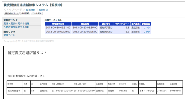
図2：震度閾値超過店舗検索システムおよび出力される店舗リスト