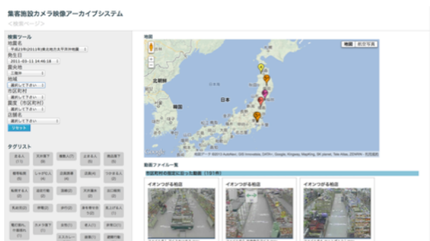
図3：映像アーカイブシステム

「震度閾値超過店舗検索システム（図2）」は、事前準備として情報登録が完了している集客施設の中から、気象庁の震度速報により一定以上の震度に見舞われた自治体内に存在する店舗を抽出したリストを作成し、登録したメールアドレスに映像回収依頼を配信するシステムである。震度は企業側の対応マニュアルに合わせて設定可能であり、地震時に情報受発信環境が制限される事態も考慮し震度超過店舗リストはCSVのほかPDFでも作成し、紙媒体に出力してFAXや郵送等による送付も可能とした。