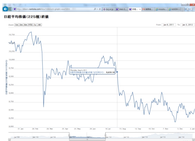
図 4. 日経平均株価の変化。震災直後と、8月に株価が大きく下落している。

TOPIC1 が、震災直後のみに比重を上げるトピックであれば、震災による不確実性に関するトピックと説明できるが、震災から回復しつつある8月にも比重を高めていて、それが株価下落と強く相関している。8月は、電力供給問題、円高進行などの国内要因により、海外に企業シフトが起こるのではないかという不安が高まり、結果として株価下落につながったと考えるのは妥当である。よって、我々は、TOPIC1を、「日本経済の先行きに関する不安」を示すトピックと解釈した。このような、株価の下落と強い相関をもつトピックが抽出できたことは、非常に興味深い。