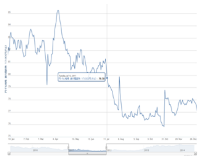
図 3. 対ドル為替の変化. 円高が進行したのは、震災直後の 3 月 17 日(79.22 円), 8 月 3 日(77.18 円), 10 月 28 日 (75.84 円). 矢印は、7 月と 11 月を表している。